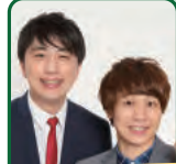
とうきょうホイクマン

現在は埼玉県の認定こども園の理事長としてメディア出演や全国で講演会などで活躍している。