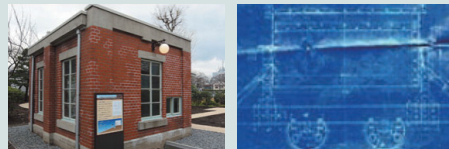
トロッコ設計図/大正9年(イメージ)

下水から取り除いた土砂やゴミを積んだ土運車(トロッコ)を坂の上まで引き上げる機械が設置されていました。