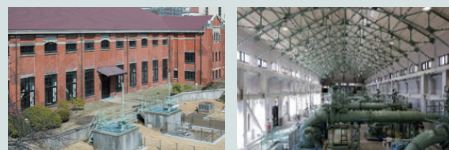
写真は全てイメージです