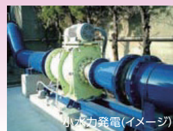
小水力発電(イメージ)