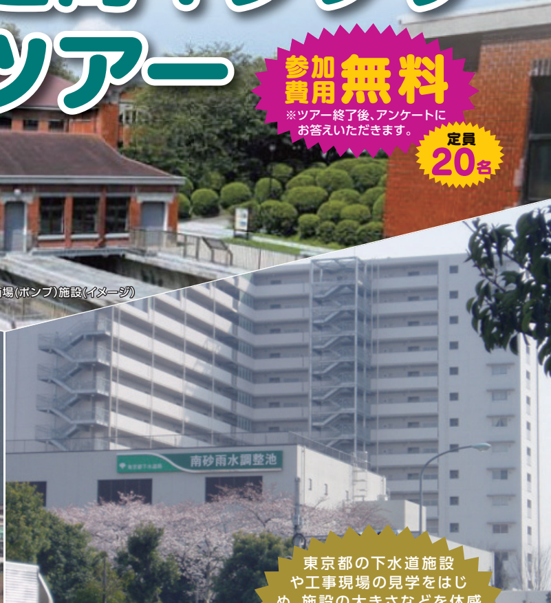
南砂雨水調整池(イメージ)

東京都の下水道施設や工事現場の見学をはじめ、施設の大きさなどを体感し、楽しみながらその存在や魅力、意義について理解を深めるツアーです。