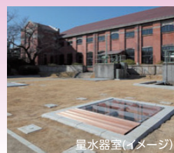
量水器室(イメージ)

○定員:20名(定員となった場合、抽選となりますのでご了承ください) 申込締切:1月16日 18:00まで