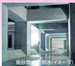
南砂雨水調整池(イメージ)