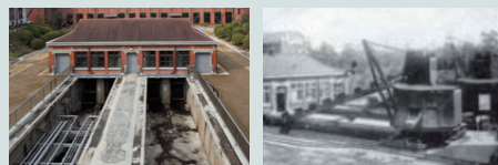
当初の沈砂池(イメージ)

東・西に各1池あり、下水を池の中でゆっくり流して、下水中の土砂類を沈殿させて、取り除きます。