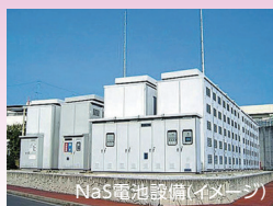
NaS電池設備(イメージ)