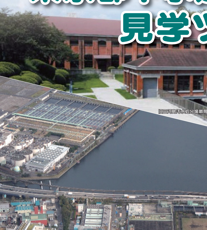
旧三河島污水処分場唧筒場(ポンプ)施設(イメージ)