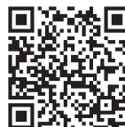
電子申請・ 届出サービス