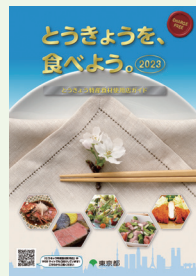
ガイドブック 見本