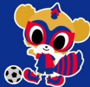
FC東京チームマスコット 東京ドロンバ