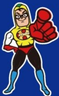
東京都健康づくり推進キャラクター ケンコウデスカマン