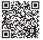
ライブ配信申込QRコード

開催3日前までに、お申込み時に記載いただいたメールアドレスにZoomのURL等を送信いたします。 視聴にかかる通信費は視聴する方のご負担となります。後日のアーカイブ配信はございません。