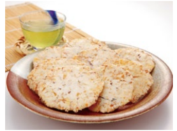
焼津かつおせんべい(静岡県) Yaizu Katsuo Senbei / Shizuoka