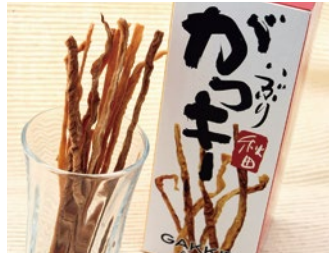
いぶりがっきー(秋田県) Gakki (Dried Iburu Gakko) / Akita