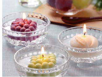
岡山名産果実あかりセット(岡山県) Fruit candle a Specialty of OKAYAMA White Peach, Muscat, Pione / Okayama