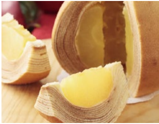
アップルクーヘン(青森県) Apple Kuchen / Aomori

Local Specialties from all 47 Prefectures, Gathered Together!