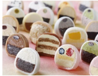
生クリーム大福(群馬県) Namakurimu Daifuku 12SET / Gunma