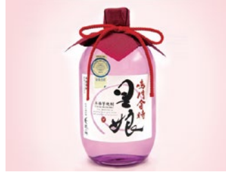
本格芋焼酎 鳴門金時 里娘(徳島県) Naruto Kintoki Satomusume / Tokushima