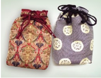
西陣織巾着(京都府) Nishijin Textile Purse / Kyoto