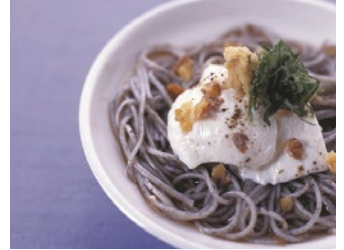
手延べ黒ごま麺(長崎県) Black Sesami Thin Noodles / Nagasaki