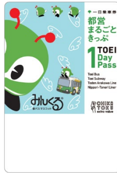
みんくる デザイン