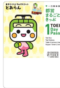
とあらん デザイン