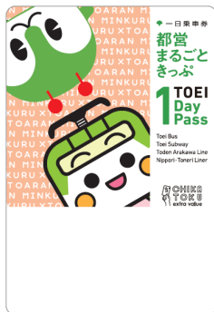
みんくる&とあらん デザイン