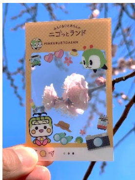
限定のクリアカード

※フォトスポットに常駐しているスタッフにスタンプラリーの完了画面をご提示ください。