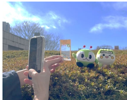
クリアカードの使用イメージ