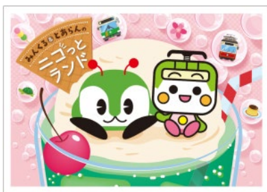
ランチョンマット