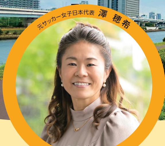
元サッカー女子日本代表 澤穂希