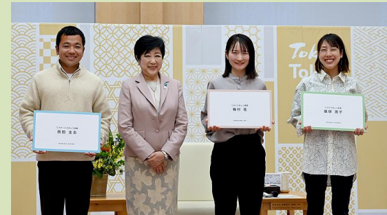
ミスとうきよ農業 ミスとうきよ林業 ミスターとうきよ漁業