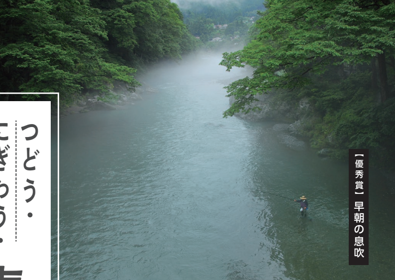
「優秀賞」早朝の息吹