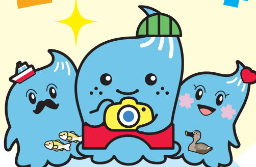
かわいこちゃんパパ かわいこちゃん かわいこちゃんママ