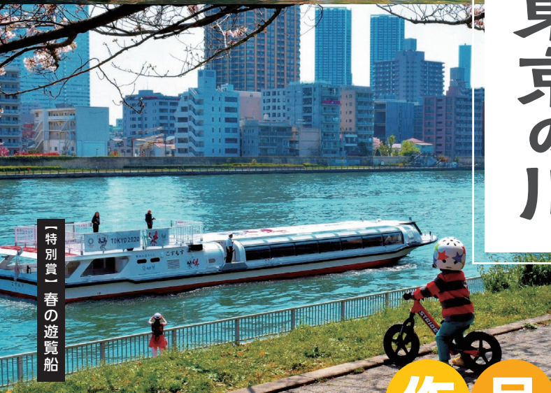
「特別賞」春の遊覧船