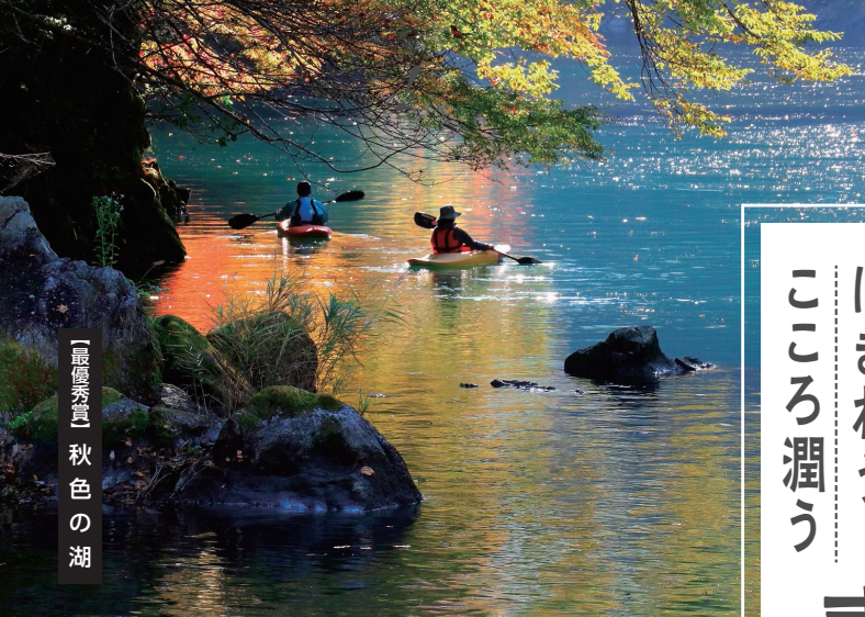
「最優秀賞」秋色の湖