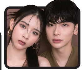
よしあき・ミチ (モデル、タレント)