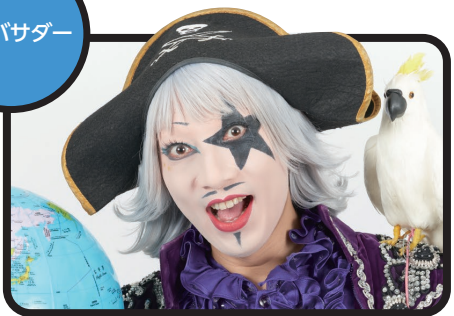
ゴー☆ジャス (芸人、タレント)