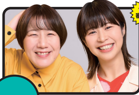
Aマッソ (お笑いコンビ)