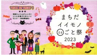
イベント開催チラシ

市内の良いものや素晴らしい活動を再発見してもらうためのイベントを実施した。地道な活動と運営の工夫で、農業者や警察署など多様な主体との連携、また町田市全域からの出店を実現した。実行委員会形式としたことで、協力者が増え、商店会活動の活性化へとつながっている。