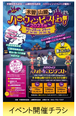
イベント開催チラシ

2つの商店街が地域教育機関と連携して、ハロウィンイベントを実施した。Instagramフォトコンテストや、商店街と大学の計3か所でのスタンプラリー等多世代が参加、交流できる催し物を企画した。本イベントを契機に、2024年度の幼小中高合同文化祭の開催へとつながっている。