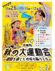
イベント開催 チラシ

女性視点での企画運営であり、近隣住民が参加しやすい独創的な取組である点、個店の広報につながる仕組みを上手く組み込んだ点などが評価された。