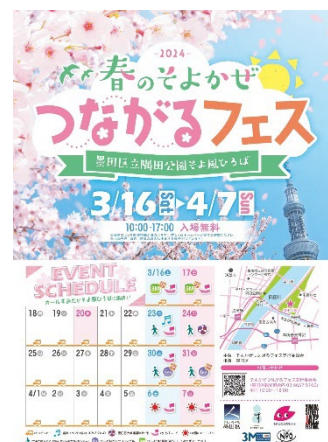
イベント開催チラシ