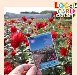
「神代植物公園のロゲットカード」

『LOGet!CARD (ロゲットカード)』は、日本全国の観光スポットを統一のフォーマットでシリーズ化したコレクションカードです。ミッションをクリアすると、ゲットできます。カードのデザインは満開の「ばら園」です。「春のバラフェスタ」の思い出にいかがですか。