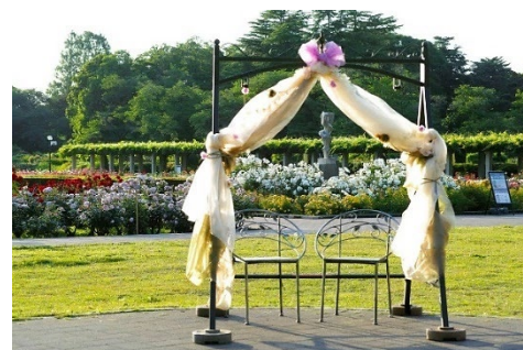
ばら園テラス前フォトスポット