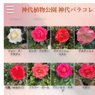
『神代バラコレ』画面の一