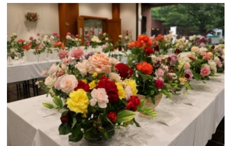
「春のバラ展」の様子(令和6年撮影)

日 程 5月8日(木)～11日(日) 場 所 植物会館1階展示室(園内マップ参照) 協 賛 武蔵野バラ会