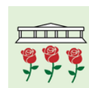
『神代バラコレ』のアイコン