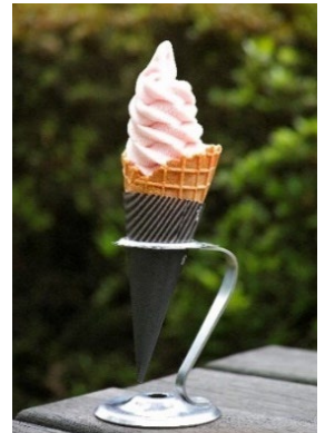
「バラのソフトクリーム」