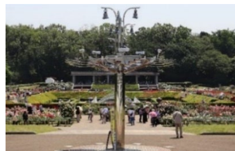
「ばら園ガイドツアー」集合場所のカリヨン