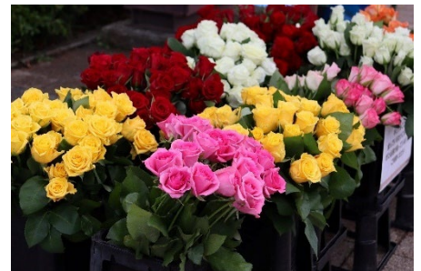
「ボタニカルショップ」(令和6年撮影)