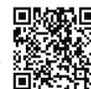
iOS 版 DL