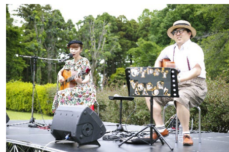
「ばらコンサート」(令和6年撮影)