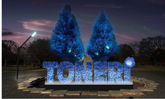
▲噴水周辺 (演出イメージ)