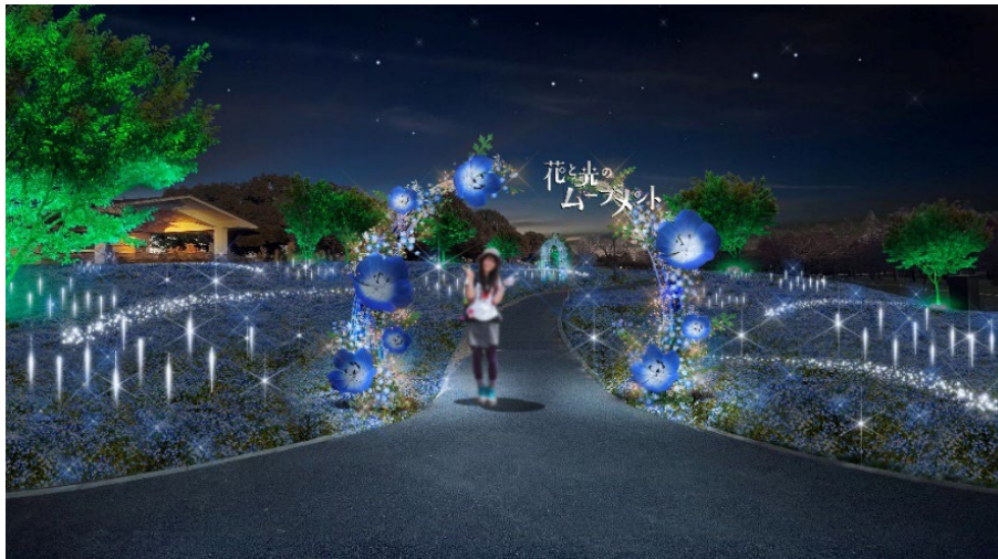
▲芝生広場 (演出イメージ)

本イベントの主演となるネモフィラ花壇では、一つひとつの小さな花が凜と美しく見えるようこだわり抜いたトネリブルーのライトで、ネモフィラの海を美しく照らします。あわせて、夜間は音による演出も実施。音に合わせて光るイルミネーションは、まるで夜空の星のよう。一面に広がるネモフィラと、舎人の空が溶け合い、幻想的な風景を生みだします。思わず息をのむような、ネモフィラの魅力があふれる世界観で、皆様をお出迎えします。