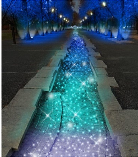
▲メタセコイア・流れ（演出イメージ）

メタセコイアの樹木は、ネモフィラの和名・瑠璃唐草（るりからくさ）にちなんだ幻想的な『瑠璃色』でライトアップ。並木の中央にある流れ（水は流れていません）は、ブルーのグラデーションカラーでライトアップし、光輝く流水のような演出をお楽しみいただけます。 ※流れはイベント期間中、休止しております。