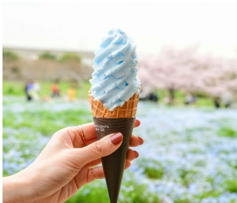
▲ネモフィラソフト（イメージ）

期間中には、キッチンカーが出店し、近くにはライトアップされた休憩スペースも登場します。また、園内の売店には、期間限定の「ネモフィラソフト」も登場します！トネリブルーとあわせて、園内でドリンクやフードをお楽しみください。