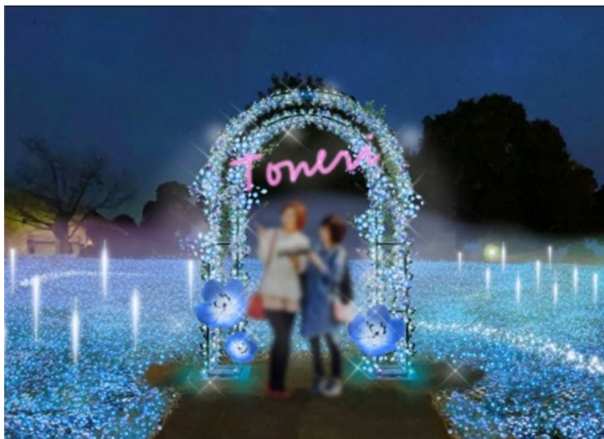
▲フォトスポット (演出イメージ)

満開のネモフィラ花壇の撮影に最適な場所には、フォトスポットを設置。トネリブルーをバックに、記念撮影をお楽しみいただけます。