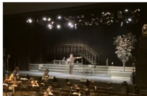
舞台事前説明会の様子

サポートを必要とされている方への配慮はもちろん、一般のお客様への配慮という意味でも、対象の方の席位置を固めて配席するようにいたしました。サポート席への移動は「見やすさ」を軸にご説明しましたが、自席で観たいという方も一定数いらっしゃったので、その際は前後左右のお客様へ、タブレット使用の意図などを丁寧に説明いたしました。