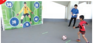
※写真は過去のイベントの様子です。