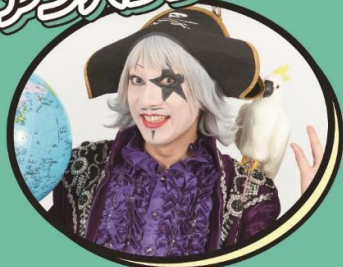
ゴ☆ジャス (芸人、タレント)