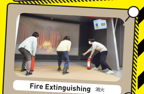
Fire Extinguishing 消火