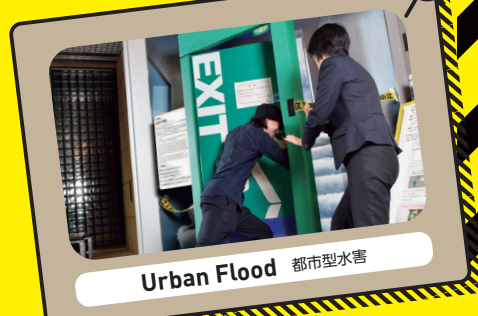
Urban Flood 都市型水害