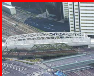
京急連続立体交差事業の完成予想図※