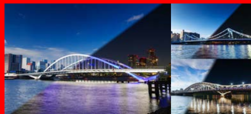
DAY & NIGHT 2025 左：築地大橋、右上：清洲橋、右下：白髭橋