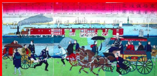
東京横浜往還之図 歌川広重（三代）1873年（高輪築堤）