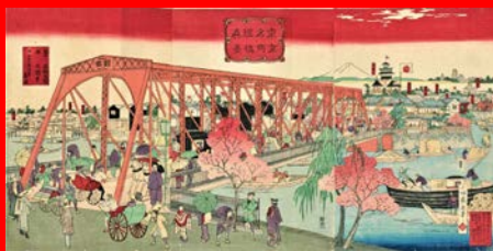
東京名所鐘橋真景 小林幾英 1888年（鐘橋）