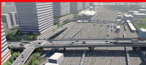
環状第4号線完成予想図※