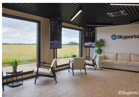
※英国Bicester Motionのターミナル施設