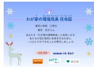
わが家の環境局長 任命証(2025冬版)