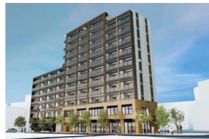
防災街区整備事業 池袋本町四丁目1・2番地区地区 （完成イメージ）