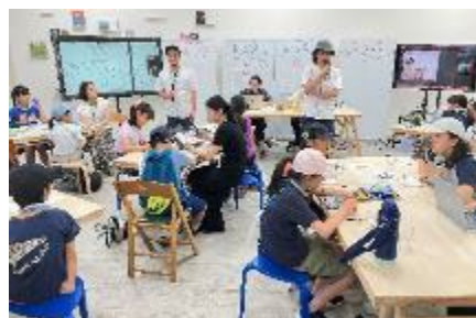
2025年度キッズユースオープンキャンパスの様子 (東京藝術大学)

Instagram (@next_creation_p) にて最新情報や取組のリアルな様子などを随時発信していきますので、ぜひフォローしてください。