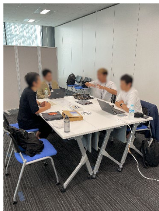
マッチング会の様子(商品開発)