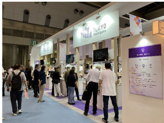
展示会出展の様子(普及促進)