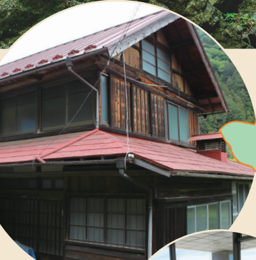
▲空き家(檜原村) (一軒)