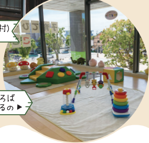
子育てひろば こころの