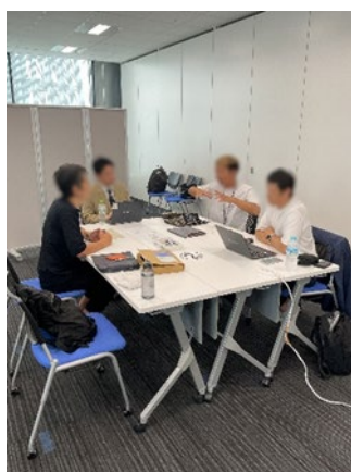
マッチング会の様子(商品開発)