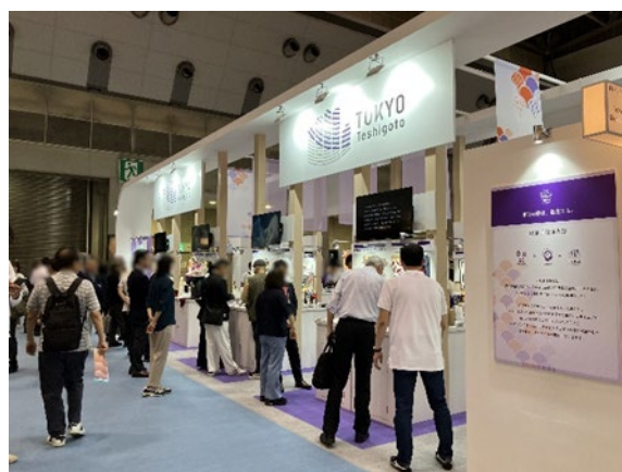
展示会出展の様子(普及促進)