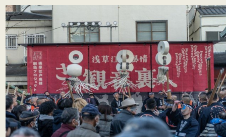
浅草神社境内での纏振り