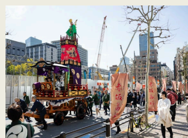
赤坂の歴史と伝統を現代に再現するパレード