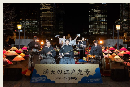
和楽器や日本舞踊のパフォーマンス