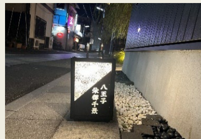
オリジナル置き行灯