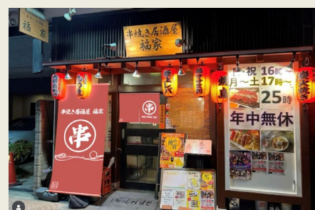
店頭を江戸風のもの装飾