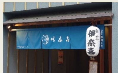
統一カラーのオリジナルのれん