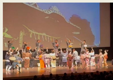
創作新内浄瑠璃劇