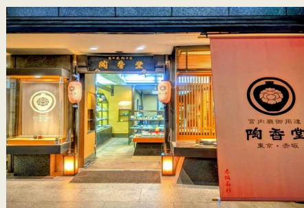
茜色の江戸風のものによる景観創出