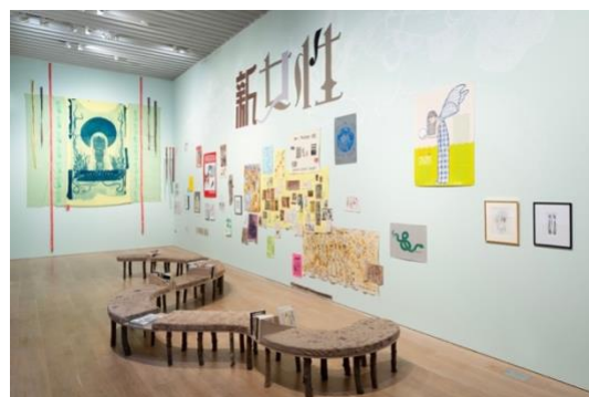
Multiple Spirits 《ダンジョンは生ける光の陰影へ》 2025 年