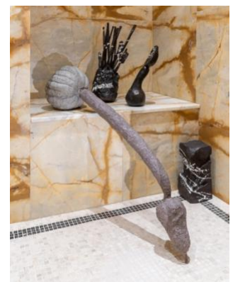
エリカ・ヴェルズッティ「Sex Scene」展示風景 2025年

パリを拠点とし、フランスのリュマ・アルルのレジデンスプログラムの責任者を務めるジュリー・ブコブザが、ブラジル出身の作家エリカ・ヴェルズッティの個展をキュレーション。彫刻とドローイングの関係、制作過程におけるイメージの生成、そして彫刻が持つ肖像性を探ります。