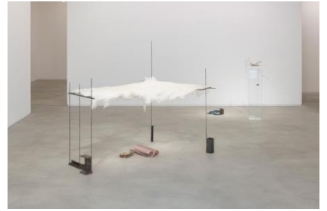
土屋信子「Stay as a Wave」展示風景 2023年

スカイザバスハウスでは、身近なものや廃材を組み合わせる立体作品を生み出す土屋信子の個展を開催。サイトスペシフィックな土屋の作品を、ロンドンのカムデン・アート・センターのディレクターを務めるマーティン・クラークがキュレーションします。