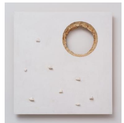
鴨治晃次《静物 / Still Life No. 10》2022年 Photo by Kei Okano. © Koji Kamoji, courtesy Take Ninagawa.

1959年にポーランドへ移住し、同国の現代美術の発展に貢献した鴨治晃次。ポーランドのザヘンタ国立美術館の元キュレーターであるマリア・ブレヴィンスカが、90歳を超えてもなお活躍し続ける鴨治の静謐な作品世界を通じて、日常、歴史、個人的記憶が交差する場を提示します。