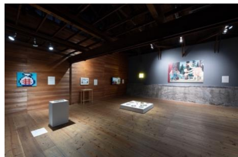
「日本国憲法展 2024」展示風景 2024年

2023年から開催されている「日本国憲法展」の2026年版。共同でキュレーターを務めるのは、早稲田大学国際学術院教授で太平洋・アジアの歴史・文化学、ジェンダー研究を専門とし国内外の展覧会企画に携わるグレッグ・ドボルザークと、インディペンデントキュレーターの小野賢。風間サチコ、オ・ハジ、高田冬彦といったアーティストたちの作品を通じて、日本国憲法を今日の社会と美術の文脈から再考します。