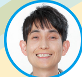
芸人・漫画家 矢部 太郎 氏