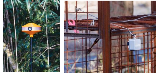
プロトタイプの完成

ハードウェア開発未経験者が、電子工作や3DCAD設計を行いプロトタイプを完成し、フィールドでの実証実験を実施。事業化に向けた支援を受けて、販売の準備を進めている。