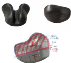
ラフモックアップ