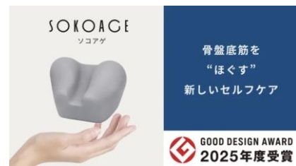
グッドデザイン賞の受賞

試作開発～少量量産体制の構築が可能な企業とマッチングした。グッドデザイン賞の受賞やクラウドファンディングによる資金調達を経て、今夏の事業化を目指している。