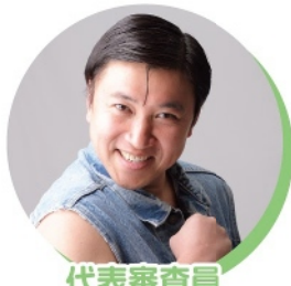
代表審査員 スギちゃん (芸人)