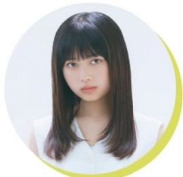
長浜広奈 (タレント)