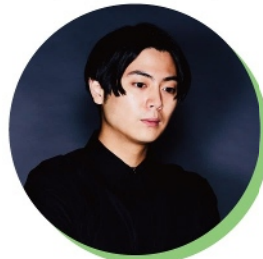
橋爪駿輝 (監督・脚本家・小説家)