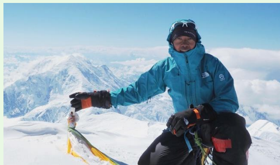
2026年6月アラスカ・デナリ山頂にて。

URL : https://creativewell.rekibun.or.jp/creativewell-conference/2026.html