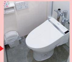
工事後(女性専用トイレ)

本事業に取り組んでいる中小企業は、東京都中小企業制度融資「女性活躍推進融資(TOKYOウイメン・ビズ・サポート)」の対象となり、信用保証料2/3補助や利率優遇を受けることができます。詳細は、下記URLにてご確認ください。