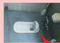
工事前 (元々は男性専用トイレ)

面接の際にトイレ新設の話をするなど女性の職場環境向上に取り組む姿勢をPRし、目標である2名の女性社員を採用することができました。 トイレのためにフロア移動することもなくなり、生産効率のアップにもつながっています!