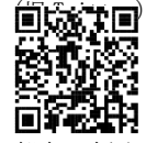
都立9庭園 公式 Instagram