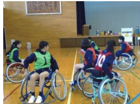
パラスポーツのクラス対抗運動会