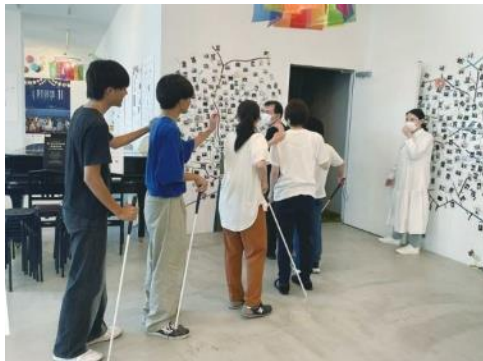
暗闇における視覚障害体験