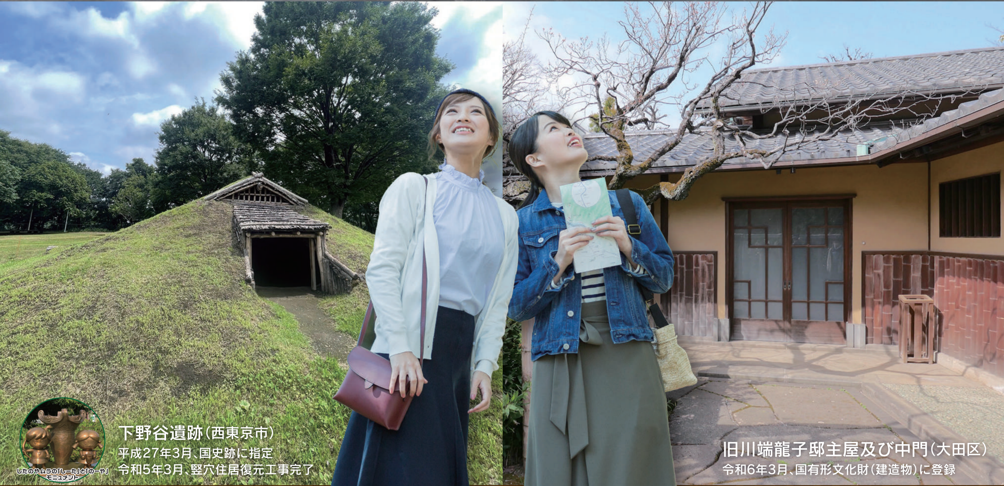
下野谷遺跡(西東京市) 平成27年3月、国史跡に指定 令和5年3月、竪穴住居復元工事完了