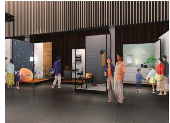
現代の暮らしと伝統工芸