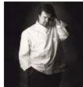
ピエール・エルメ氏 (PIERRE HERMÉ PARIS)