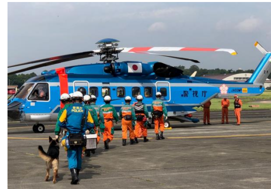
警視庁警備部災害対策課ツイッターより