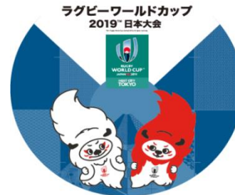
<ヘッドマークイメージ>