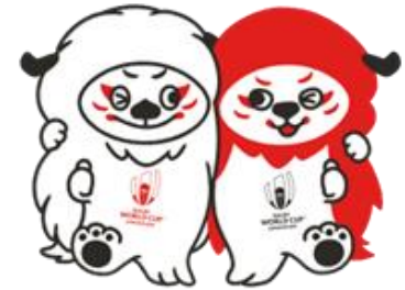
大会公式マスコット「レンジー」