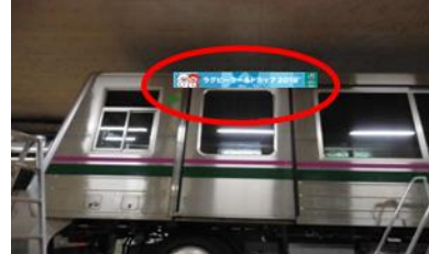
<ステッカーイメージ>