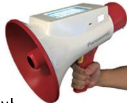
メガホン型 翻訳機