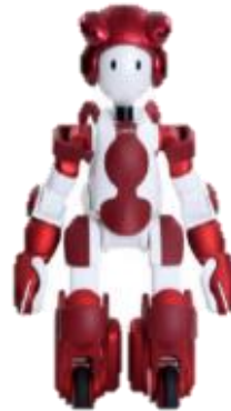
お客様ご案内ロボット