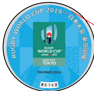
<蓋デザインイメージ>