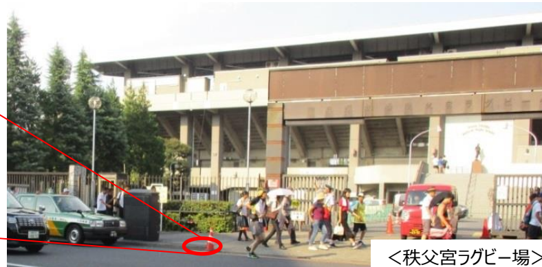
<秩父宮ラグビー場>