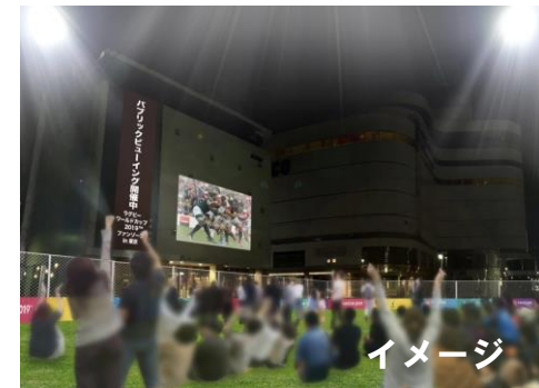
ビル壁を使用したパブリックビューイング