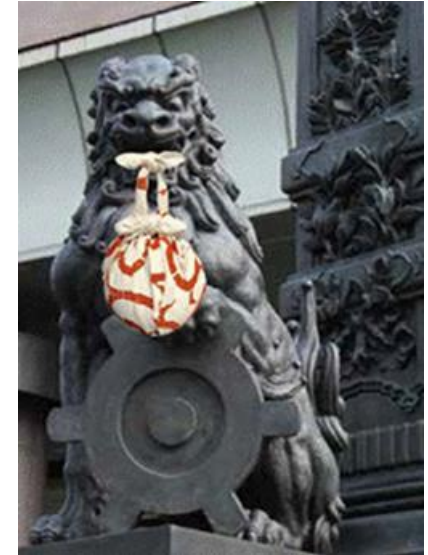
日本橋の麒麟像、獅子像でAR体験