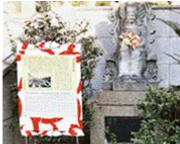
乙姫像（魚市場発祥地）