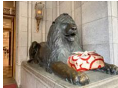
日本橋三越のライオン像