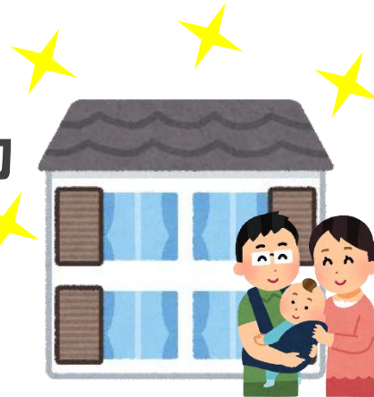
【東京ささエール住宅】