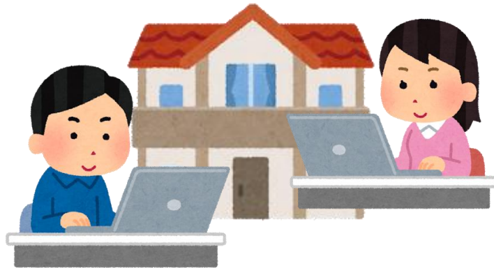
空き家をテレワークの拠点として活用

○ 5 Gや A I等の先端技術を駆使した、空き家の 住宅市場における流通 や、 利活用の促進 などの空き家対策