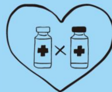
抗体カクテル療法