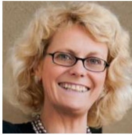
ウリケ・シェーデ