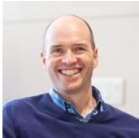
ベン・ホロウィッツ