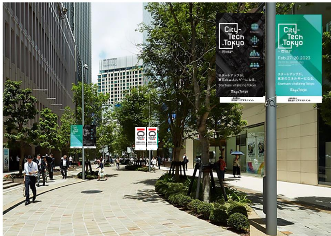
大手町・丸の内・有楽町エリア

羽田・成田空港をはじめ各地を装飾し、開催気運を高める 【掲出期間：2月13日～3月1日】