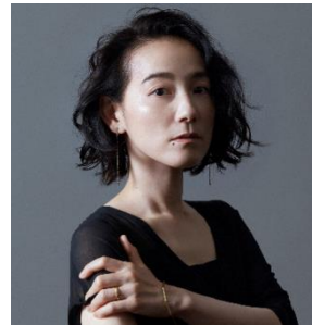
篠原 ともえ 氏 ・デザイナー／アーティスト ・ニューヨークADC賞受賞