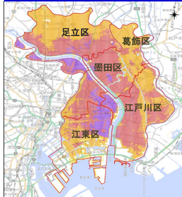
江東5区ハザードマップ