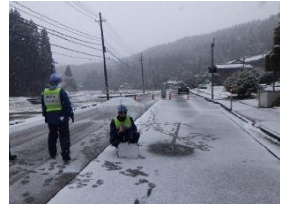
<下水道の状況確認>