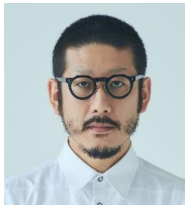
森永 邦彦氏 ファッション デザイナー